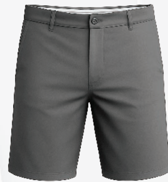
6102 Bermuda extensible 44 00 $