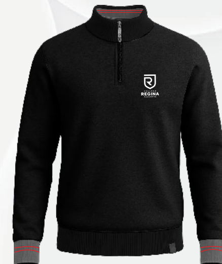
5415 Pull col zippé 60 00 $