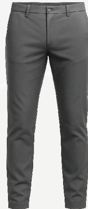
2118 Pantalon extensible 56 00 $