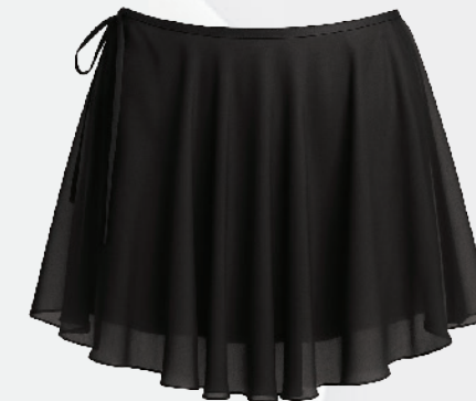
D6687 Jupe chiffon 25 00 $