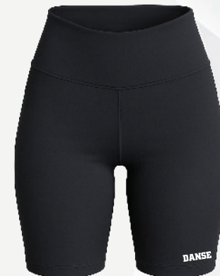
D6060 Cuissard taille haute 34 00 $