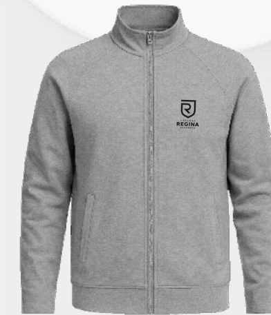
3526 Veste avec poches 51 00 $ Doit être porté sur un polo