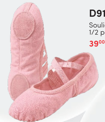
D9100 Soulier ballet 1/2 pointe 39 00 $