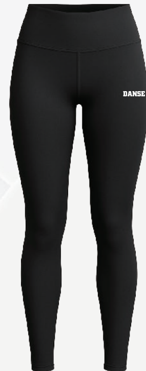
D2460 Legging taille haute 42 00 $