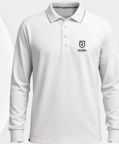
3117 Polo coton piqué 36 00 $