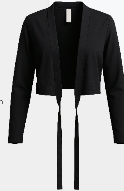
D6688 Cache-cœur manches 3/4 54 00 $