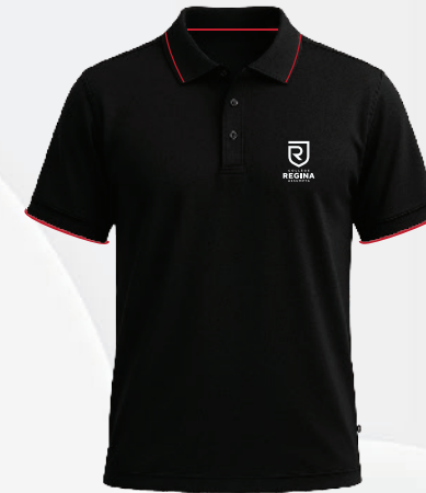
3132 Polo polyester 36 00 $