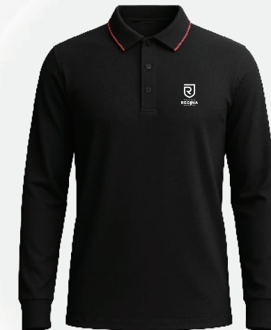
3135 Polo polyester 38 00 $