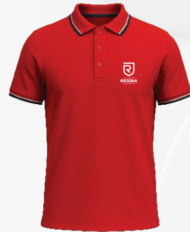
3166 Polo coton piqué 35 00 $