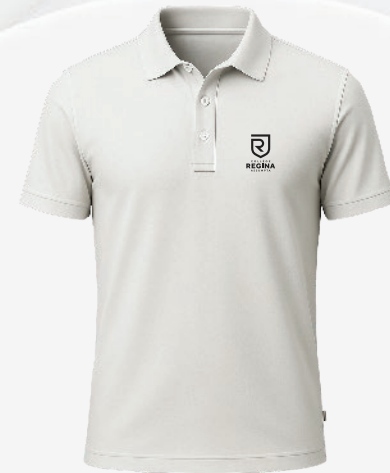
3116 Polo coton piqué 34 00 $