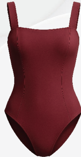
D6685 Maillot bretelles larges 62 00 $