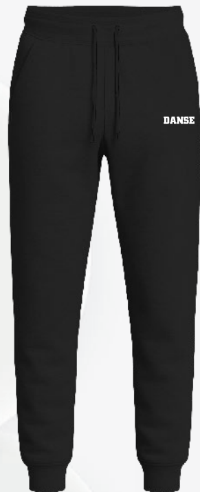
D2376 Pantalon léger 48 00 $