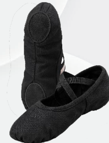
D9102 Soulier ballet (garçon seulement) 39 00 $